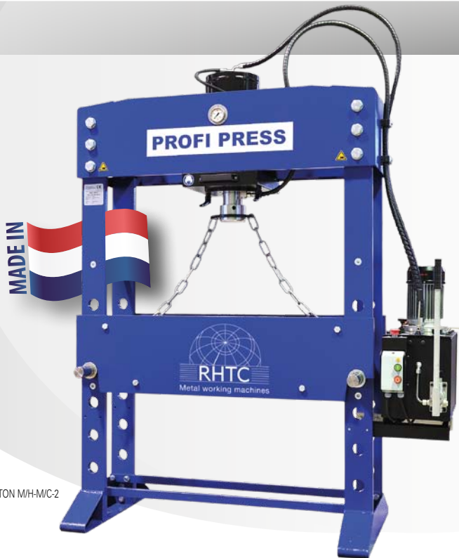
60 TON M/H-M/C-2