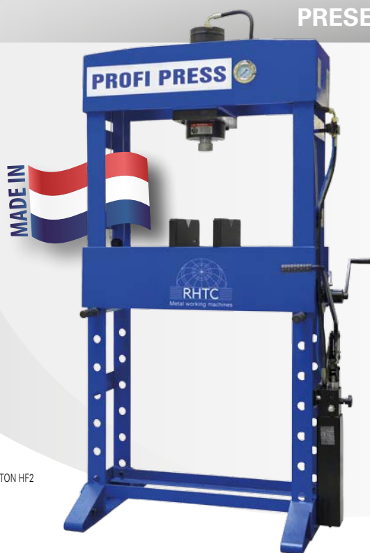
30 TON HF2